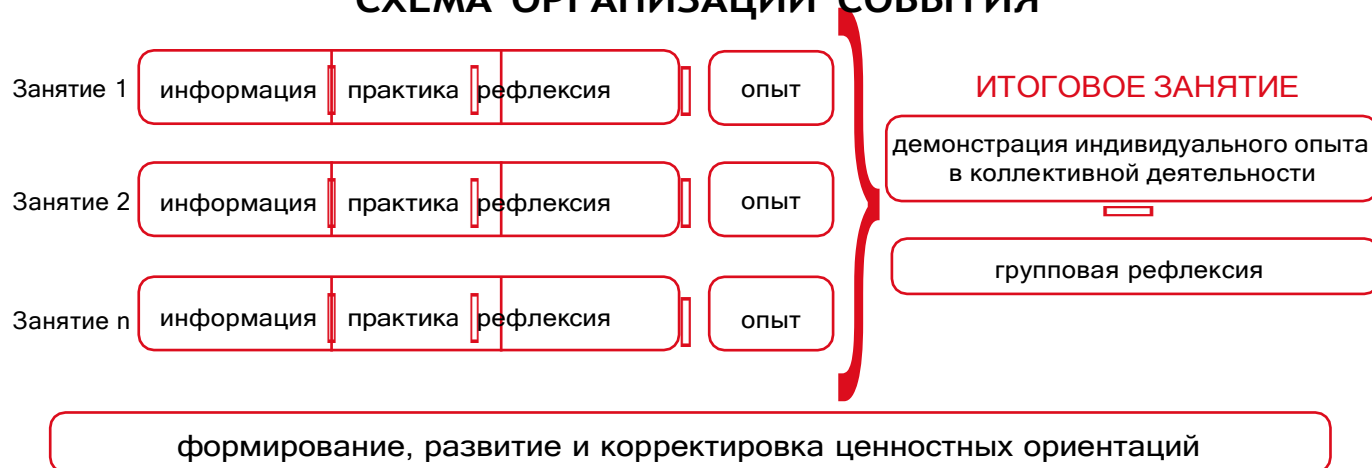
Рисунок 1 — Схема организации события

Таким образом, у пятиклассников происходит построение логической цепочки от собственного опыта проживания каждого занятия к ознакомлению с опытом других детей и к формированию общего отношения классного коллектива к прожитому ими событию.